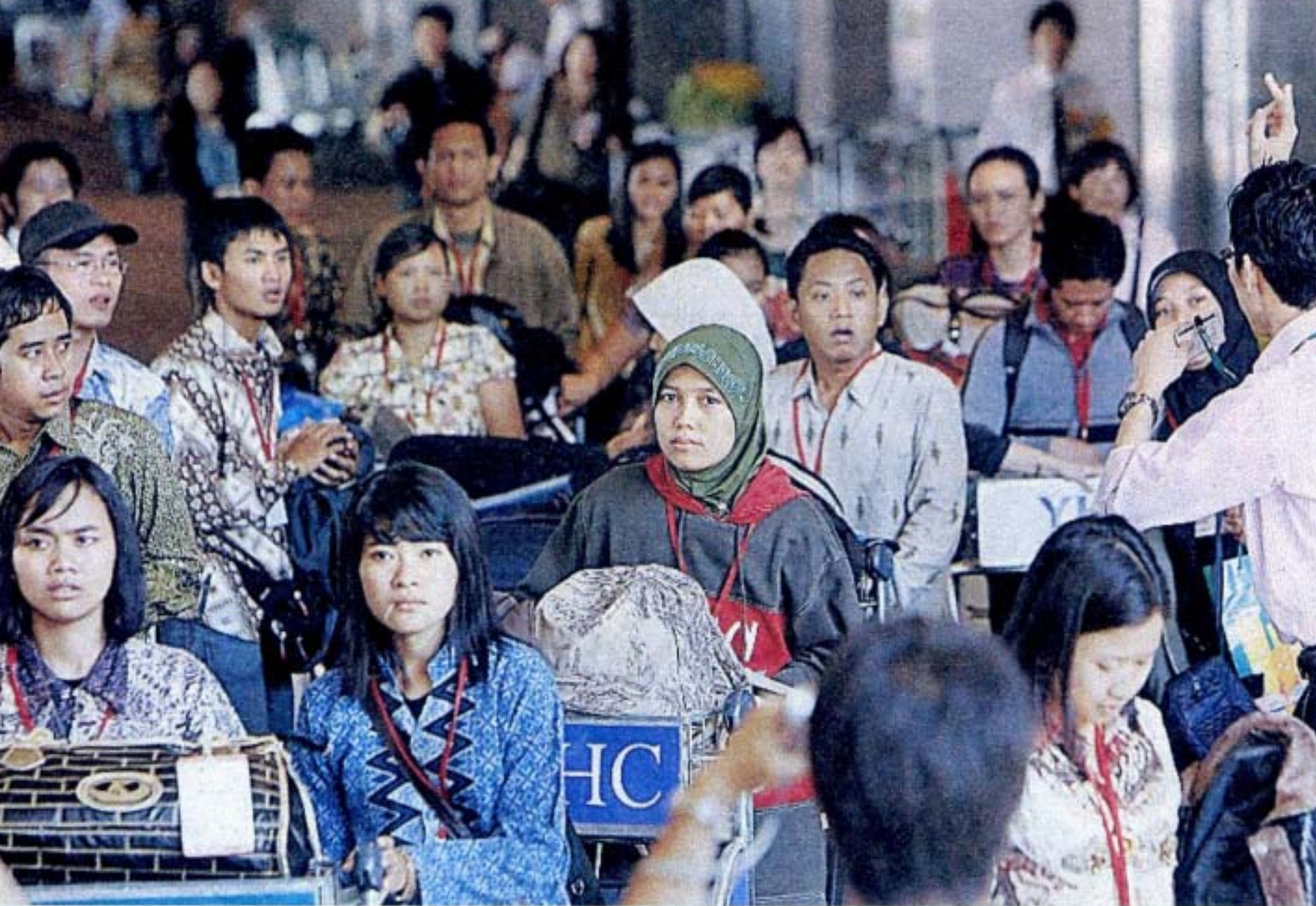
成田空港に着いたインドネシア人の看護師、介護士の候補者たち＝8日、千葉県成田市